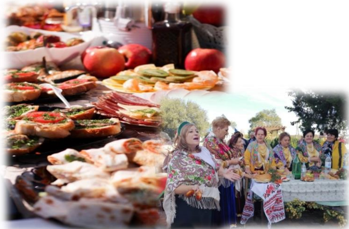
Гастрономический тур по Георгиевскому муниципальному округу